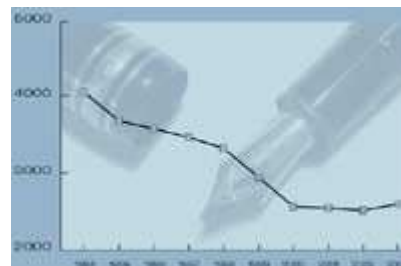
Meisterprüfungen im Friseurhandwerk

Zum Vergrößern bitte auf die Bilder klicken!