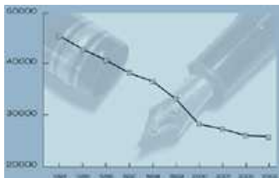
Meisterprüfungen im Handwerk